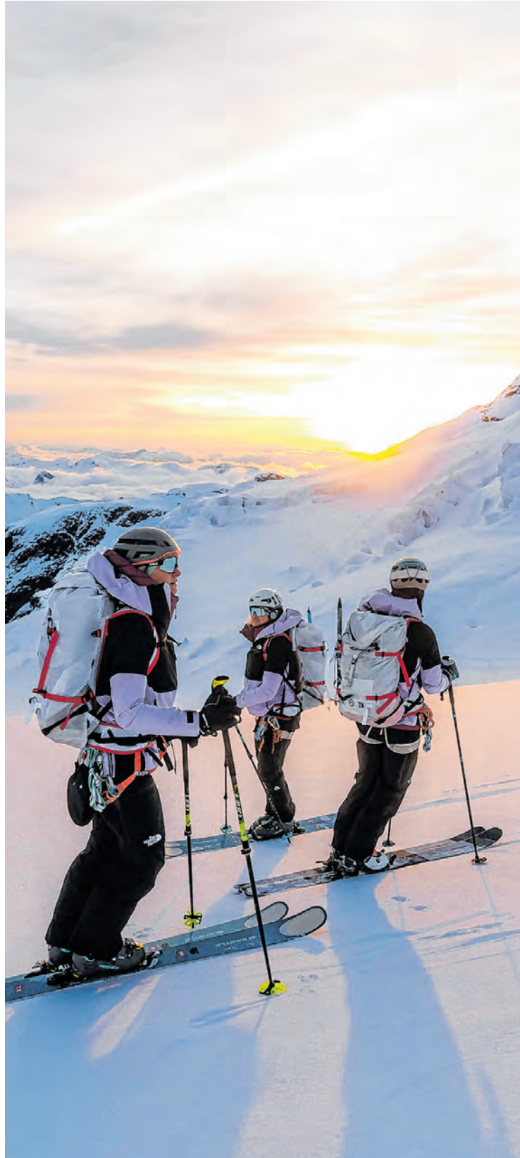
„Dare to Trust“

Die Protagonisten von DOLORE wissen, was sie tun. Sie verlassen die Welt der professionellen Wettkämpfe und begeben sich auf die Suche nach einer neuen Herausforderung – ihre erste hochalpine Splitboard-Tour. Das